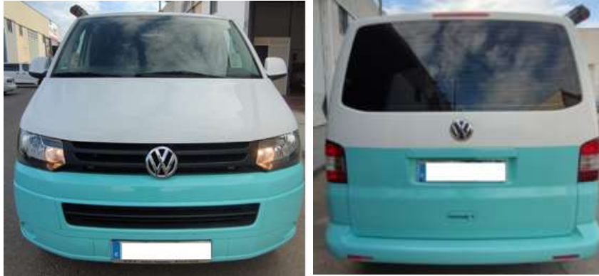
Frontal y trasera