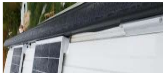
FOTO DEL SISTEMA DE FIJACIÓN