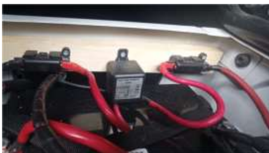
FOTO UBICACIÓN RELÉ