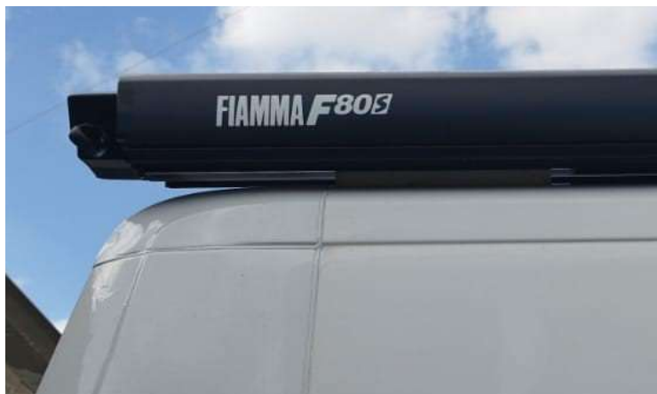
FOTO DEL MODELO Y MARCA