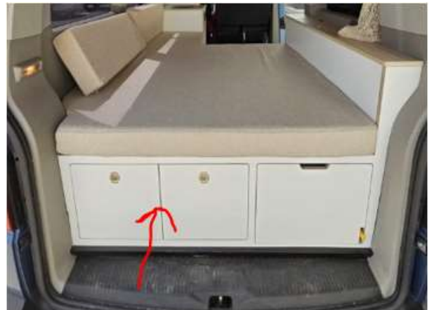
FOTO INDICANDO LA UBICACIÓN DE CADA ZONA DE INSTALACIONES

Fotos mostrando todos los equipos a homologar instalados (Batería, caja de fusibles, booster, inversor, cargador, regulador solar, boiler eléctrico, nevera etc..)