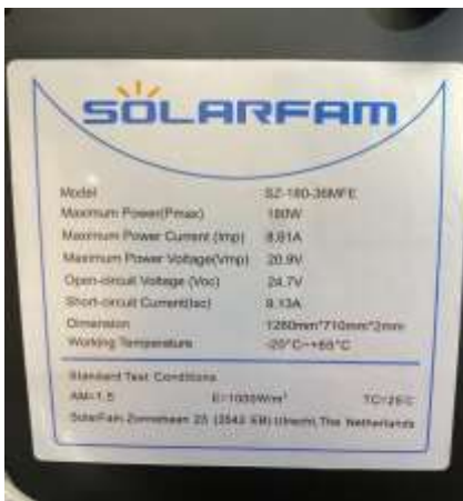
ETIQUETA PANEL SOLAR

Una foto de cada tipo para ver el tipo con la tapa abierta