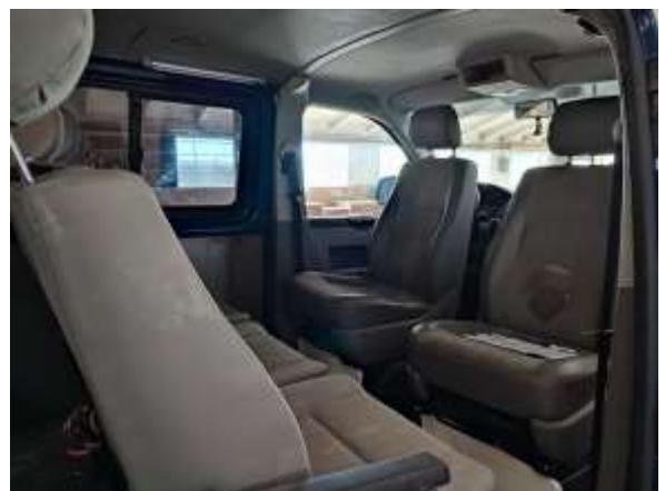
FOTO ASIENTOS GIRADOS