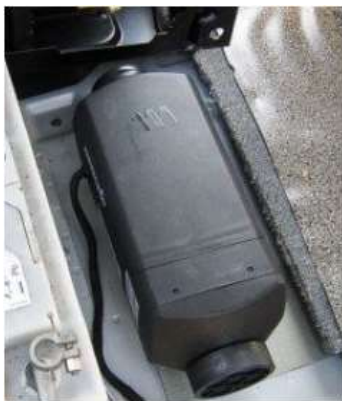
FOTO UBICACIÓN EQUIPO PRINCIPAL

Foto mostrando donde está ubicado el equipo y conforme está fijado directo al suelo original del vehiculo (suelo de chapa no madera) sin contacto con ningún material inflamable a menos de 2cm del equipo y en un espacio ventilado