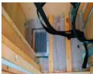
ARMARIO CON BOMBONA+ REGULADOR + VENTILACION INFERIOR