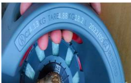
FOTO DE LA MARCA Y CAPACIDAD DE LA BOMBONA