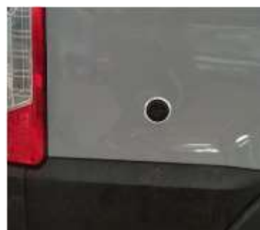
TOMA ALIEMENTACION EXTERIO DE GAS