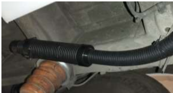
FILTRO AIRE ASPIRACION

Foto del filtro de aspiración de aire en los bajos