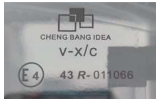
Foto de la etiqueta 43R de la tapa