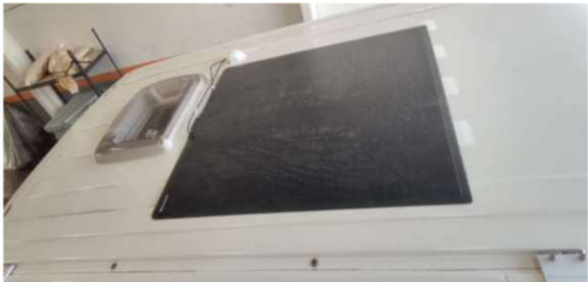
Techo entero exterior