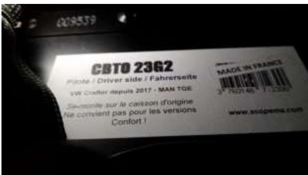
ETIQUETAS BASES GIRATORIAS PILOTO Y COPILOTO