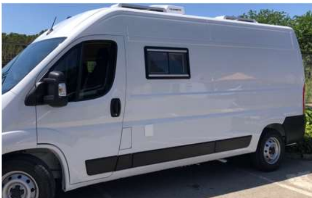
FOTO EXTERIOR PARA VER UBICACION