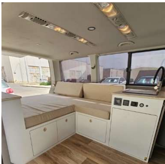
Desde el interior viendo la zona trasera