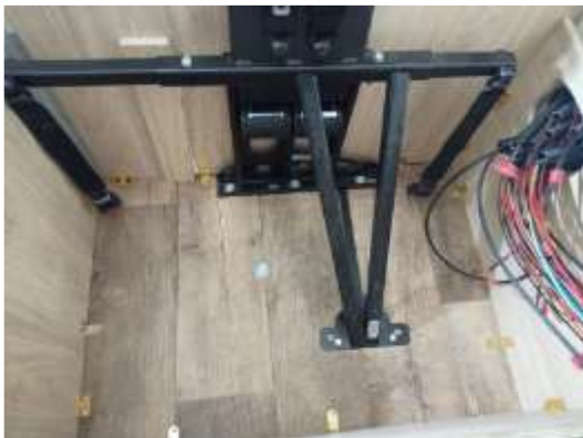
FOTO VIENDO ESTRUCTURA VIENDO LOS ANCLAJES AL SUELO