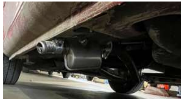
TUBO EVACUACIÓN GASES

Foto del filtro de aspiración de aire en los bajos