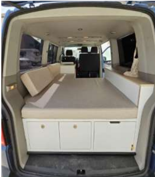
Desde atrás viendo todo el interior