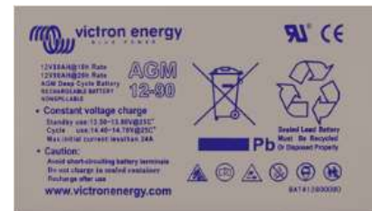
FOTO VIENDO EL MODELO DE BATERIA

Viendo marca + modelo + CE y 10R si dispone