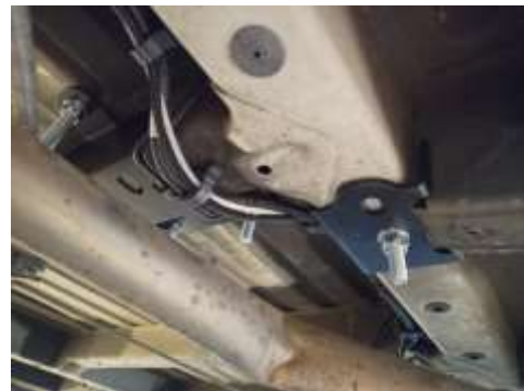
REFUERZOS QUE VAN EN LOS BAJOS DEL VEHÍCULO