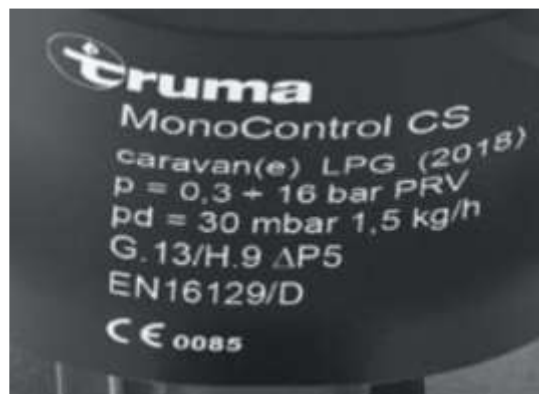
ETIQUETA DEL REGULADOR DE GAS