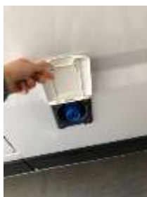
TOMA EXTERIOR 230V