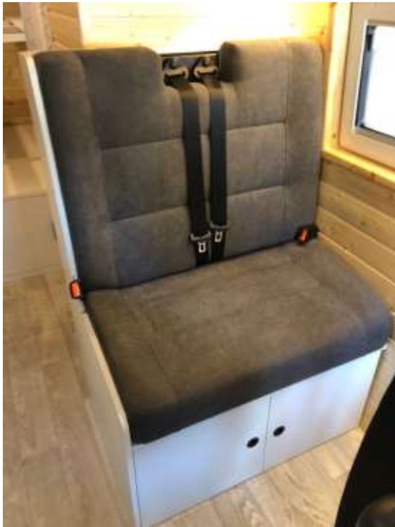
ASIENTO ACABADO CON EL TAPIZADO Y SIN REPOSACABEZAS