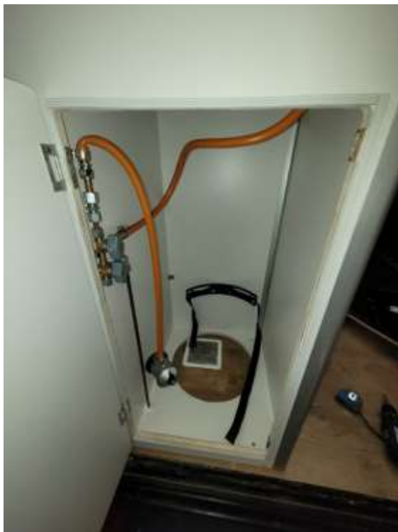
ARMARIO SIN BOMBONA Y VENTILACION INFERIOR