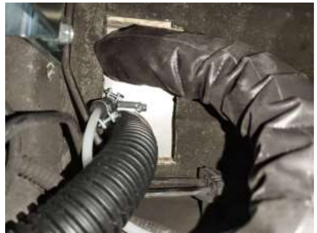
FOTO DE LA SALIDA DE LOS TUBOS

Foto mostrando donde está ubicado el equipo y conforme está fijado directo al suelo original del vehiculo (suelo de chapa no madera) sin contacto con ningún material inflamable a menos de 2cm del equipo y en un espacio ventilado