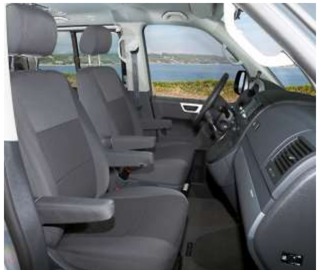
Zona de la cabina