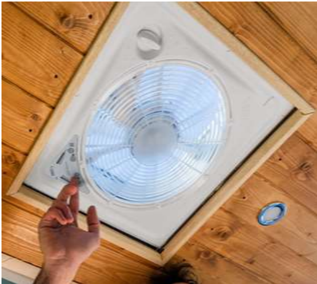
FOTO DESDE EL INTERIOR

En las claraboya marca FIAMMA VENT ya disponemos de estas etiquetas resto de marca si hay que enviarlas