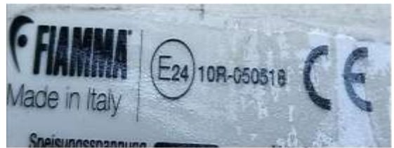
Foto de la etiqueta 43R del ventilador (solo si lleva ventilador)