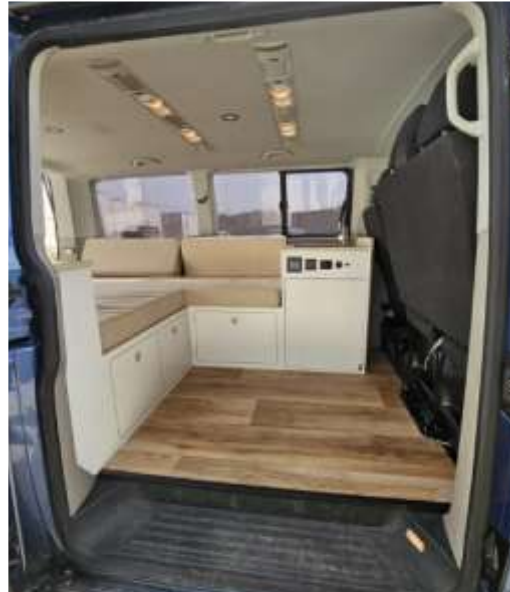
Desde puerta lateral viendo todo el interior