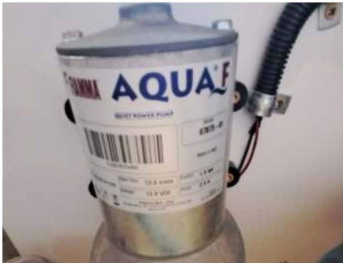
FOTO ETIQUETA EQUIPOS ELECTRONICOS

Fotos mostrando todos los equipos a homologar instalados (Depósitos del interior, bomba, vaso, boiler, etc..)