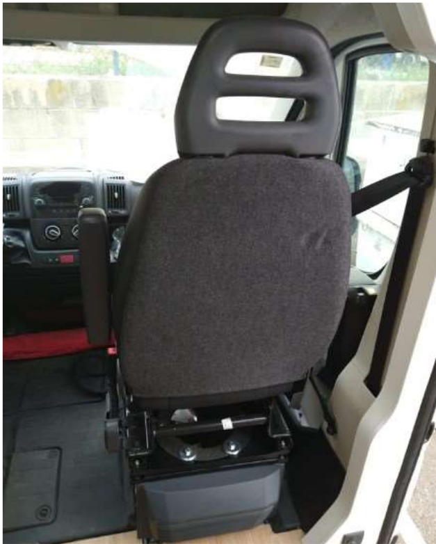
ASIENTO COMPLETO DESDE ATRÁS