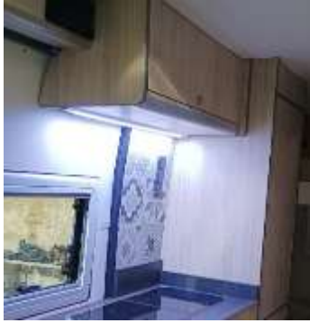
FOTO LUCES DEL INTERIOR