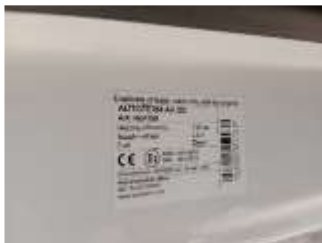
PEGATINA DE RECAMBIO

Foto zona de evacuación de los gases inquemados